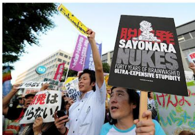
*Chau centrales. 40 años de lavado de cerebro. Estupidez ultra-cara.

Ayer volvió a funcionar un reactor nuclear en Japón, tras la crisis en la central Fukushima Daiichi. El gobierno nipón justificó que empieza la época de mayor demanda energética, pero hubo manifestaciones sociales en su contra. Una ONG japonesa explicó a ComAmbiental que el pedido de fondo es por un modelo energético que sea democrático y con fuentes renovables y limpias.