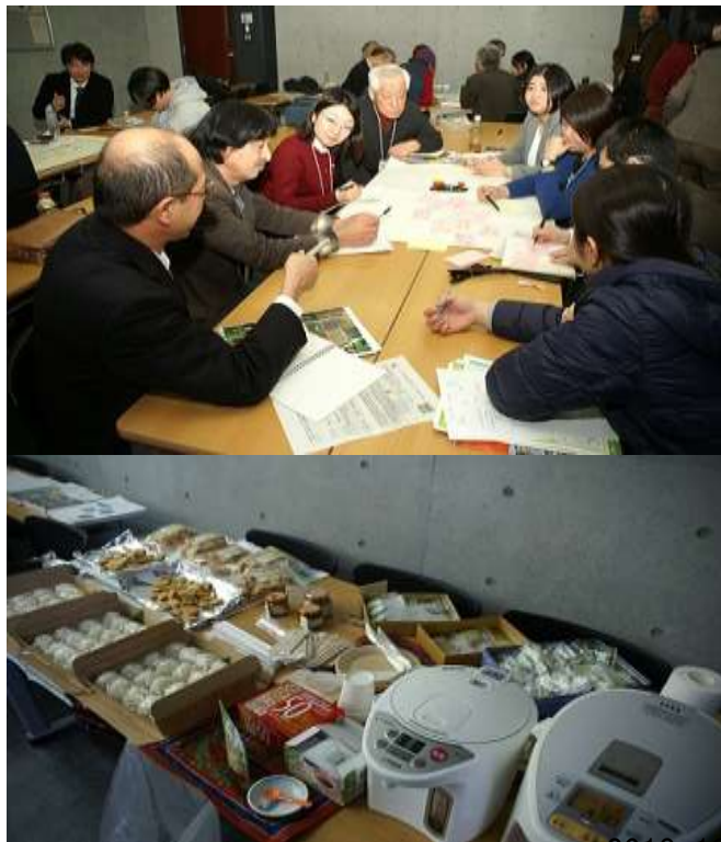
にじゅうまるC O P 3分科会